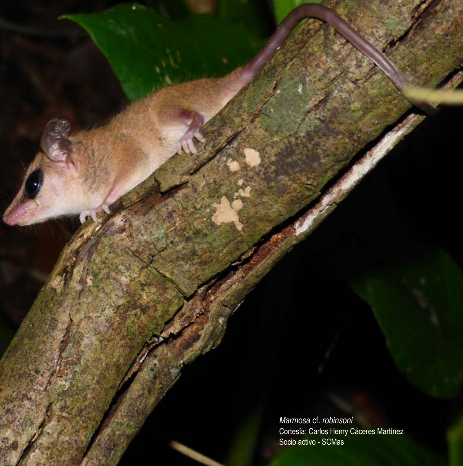
Marmosa cf. robinsoni Cortesía: Carlos Henry Cáceres Martínez Socio activo - SCMas